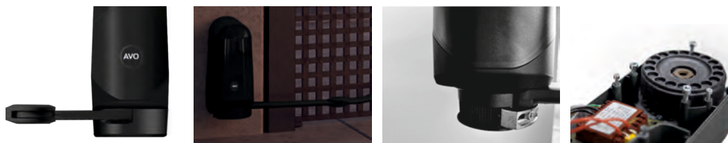
Montaż na wąskim słupku (10x10 cm)

Fotokomórki: para fotokomórek zewnętrznych przeznaczonych do montażu na wąskich słupkach z możliwością regulacji o 180° w standardowym wyposażeniu każdego zestawu.