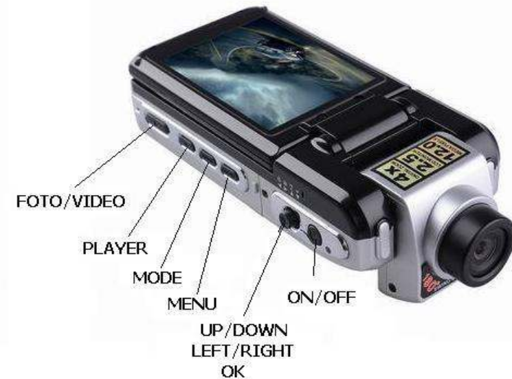
Dioda led do podświetlania