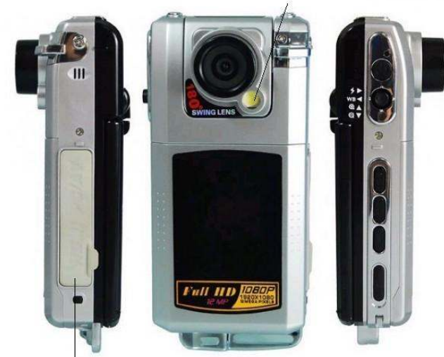
Złącze USB oraz HDMI